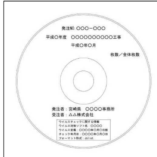
図 2 電子媒体への表記例

第 3 電子検査に必要な機器及び電子成果品閲覧用のソフトウェアは、原則として受注者が用意するものとする。ただし、発注者と受注者が協議の上、発注者が用意することを妨げない。