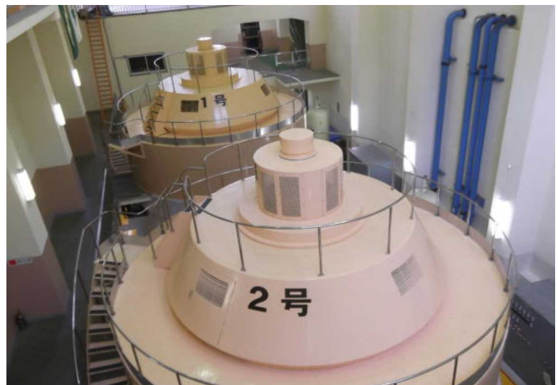
発電機 (1号機(奥)、2号機(手前))