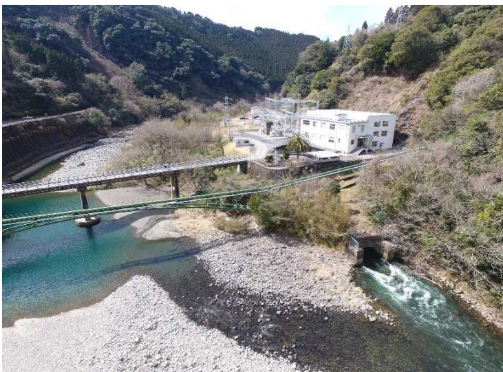
綾第二発電所 全景